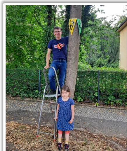
bunte Wimpel markieren die autofreie Zone

Diese Zone ist durch bunte Wimpel markiert.