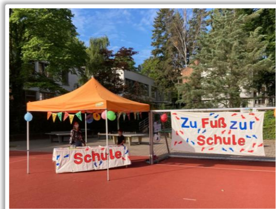
Infostand auf der Einschulungsfeier

Für die Kinder gab es kleine Geschenke, für die Großen viele interessante Informationen.