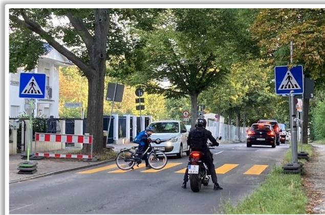
Eine (halbwegs) sichere Querung für unsere Kinder in der Crailsheimer Straße