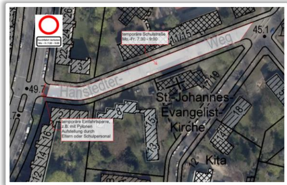
Temporäre Schulstraße im Hanstedter Weg

Entsprechende Anträge wurden dem Tiefbauamt am 05.07.21 übermittelt.